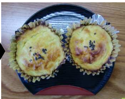
スイートポテトになりました