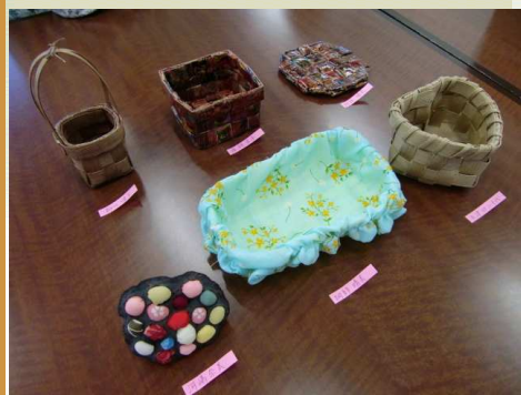
利用者様の手芸作品